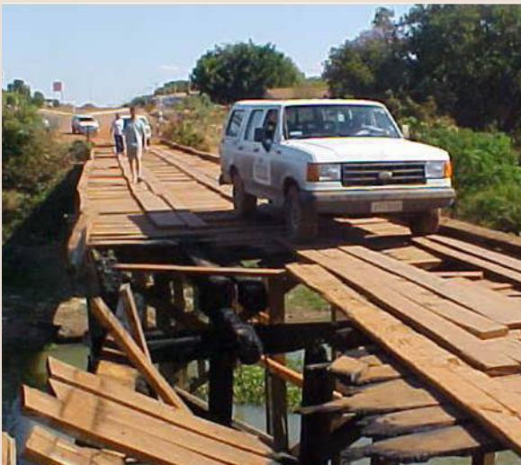
Una muestra de los efectos de la corrupción: un camión comprado para ser utilizado como bus escolar y un puente mal construido.

Los votantes desaprueban la corrupción, sin embargo no disponen de la suficiente información para votar acordemente. En ausencia de las auditorías, la persistencia en las tasas de reelección para diferentes niveles de corrupción sugiere que los votantes no disponían de suficiente información respecto de sus representantes.