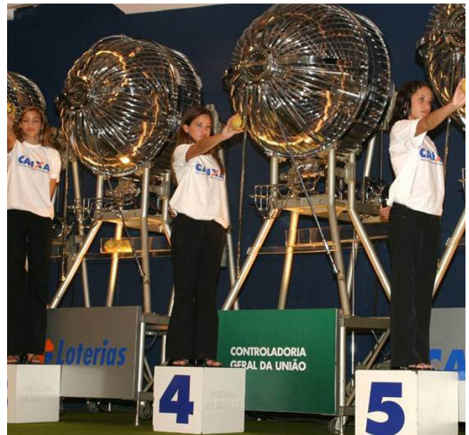
Proceso público de selección aleatoria de municipalidades.

Para cada municipalidad, un resumen de los principales hallazgos de la auditoría fue publicado en internet y enviado a los principales medios de prensa. Aunque los investigadores no disponen de evidencia directa de que los votantes tuvieran conocimiento de los informes, reportes de los medios locales sugieren que la información de la auditoría fue usada ampliamente durante la elección.