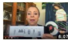
هل ليس البنات سبب التحرش؟