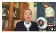
يعني اي التحرش الجنسي و عقوبته ايه؟