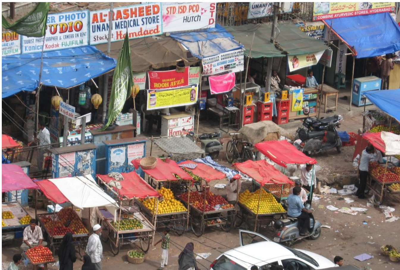
Small businesses in Hyderabad, India

Lanzada en 1998, Spandana es una de las organizaciones de micro-finanzas más grandes y de mayor crecimiento en la India, con 1,2 millones de clientes activos en 2008. Spandana ofrece préstamos tradicionales de microfinanzas, en los cuales grupos auto-formados de seis a diez mujeres reciben los préstamos. Un "centro" se compone de 25-45 grupos y para afiliarse un individuo debe (i) ser mujer, (ii) tener entre 18 y 59 años, (iii) ser residente en la misma zona durante al menos un año, (iv) poseer una identificación válida y certificación de residencia y (v) al menos el 80% de las mujeres en un grupo debe tener su casa propia.