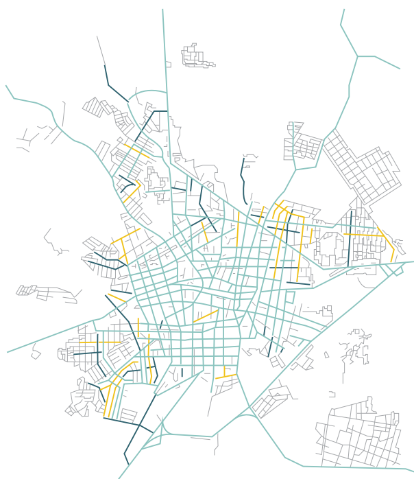
Location of street pavement projects in Acayucan, Mexico

Los datos fueron levantados vía encuestas al hogar, antes y después del proyecto, además de que se obtuvieron tasaciones profesionales de los valores de propiedad residencial entre 2006 y 2009. La población objetivo de la encuesta consiste en todas las viviendas ocupadas en calles que fueron seleccionadas para el experimento, incluyendo 1231 hogares en 2006 y 1083 hogares en 2009.