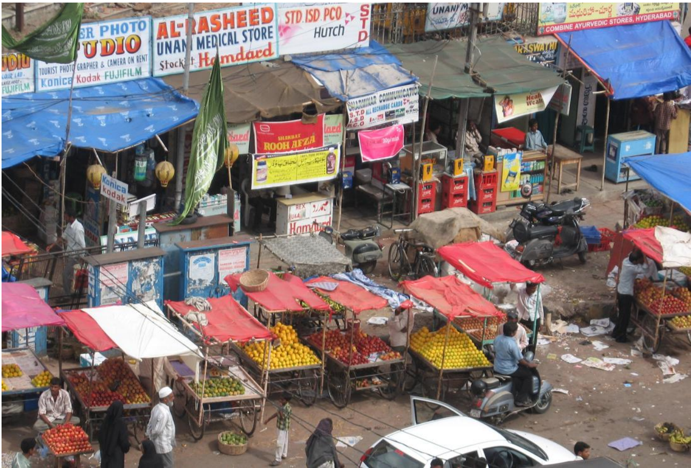
Small businesses in Hyderabad, India

Créé en 1998, Spandana est l'un des organismes de micro-finance le plus important et le plus dynamiques d'Inde. En 2008, il comptait 1,2 millions d'emprunteurs actifs. Spandana propose des prêts de micro-finance classiques, à des groupes auto-constitués de six à dix femmes recevant des prêts collectifs. Un "centre" se compose de 25 à 45 groupes, et pour en devenir membre, l'emprunteur doit (i) être une femme, (ii) âgée de 18 à 59 ans, (iii) avoir résidé dans la même circonscription depuis au moins un an, (iv) posséder une pièce d'identité valide et une preuve de résidence, et (v) au moins 80% des femmes constituant un groupe doivent être propriétaires de leur logement.