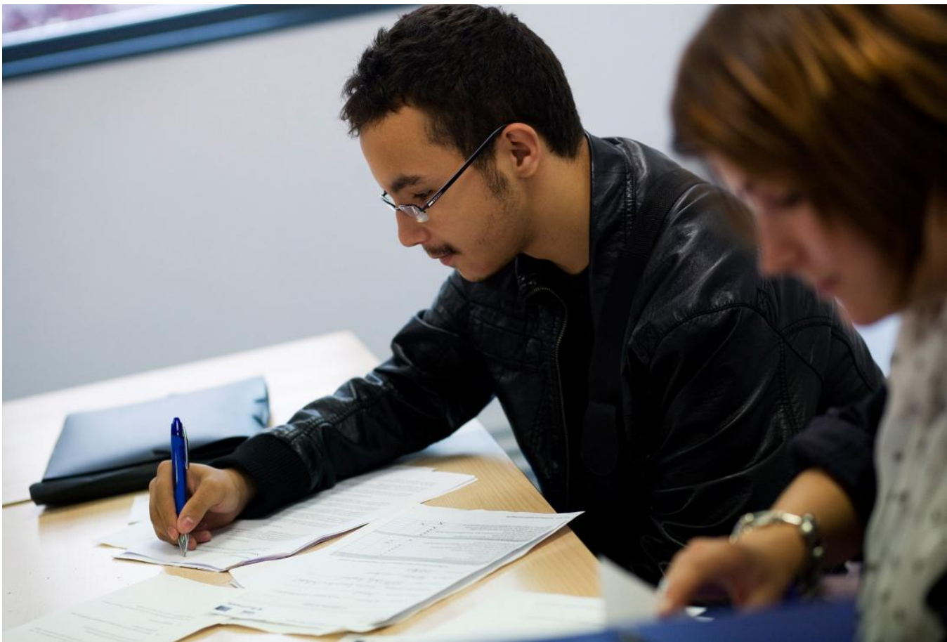
French man working on his CV

Afin de lutter contre ce genre de discrimination, la France a adopté en 2006 une loi qui imposait la suppression des noms et adresses des candidats dans tous les documents présentés pour une demande d'emploi. Cependant, cette loi n'a jamais été appliquée. En 2009, le gouvernement a plutôt décidé de lancer un programme où des entreprises pouvaient choisir d'accepter seulement des CV anonymes durant le processus d'embauche géré par le service public d'emploi, Pôle Emploi, afin d'évaluer son impact.