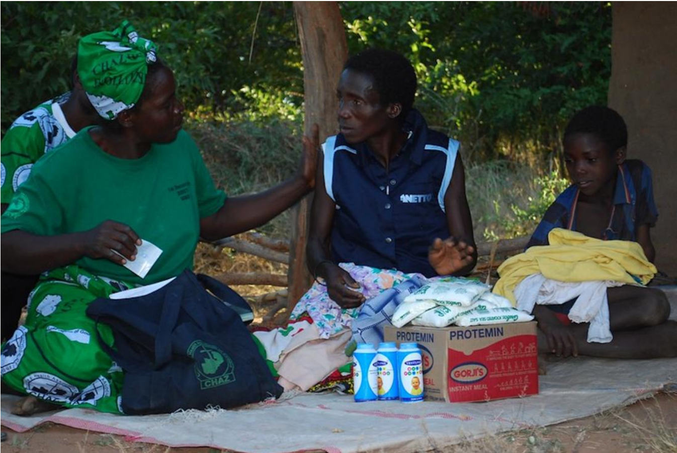
A community health worker helps patients in Zambia.

En 2010, le gouvernement zambien a lancé une initiative nationale pour créer un nouveau poste de fonctionnaire : celui d'agent de santé communautaire ( Community Health Worker ). Ces agents suivent une année de formation professionnelle avant de retourner travailler dans leur communauté rurale d'origine. La majeure partie de leur temps de travail est consacrée à des visites à domicile, mais ils passent également une journée par semaine au poste sanitaire de leur communauté et organisent des réunions d'éducation à la santé. Pour les Zambiens qui vivent dans les régions les plus reculées du pays, ces agents constituent la première ligne des services de santé.