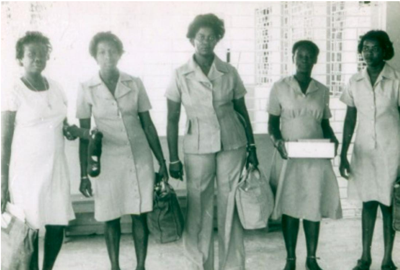
Photographie originale d'assistantes de santé communautaire se préparant pour leur tournée hebdomadaire de visites à domicile en Jamaïque