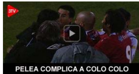
PELEA COMPLICADA A COLO COLO