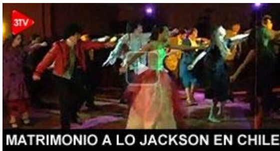
MATRIMONIO A LO JACKSON EN CHILE