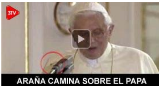
ARAÑA CAMINA SOBRE EL PAPA