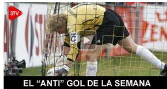
EL "ANTI" GOL DE LA SEMANA