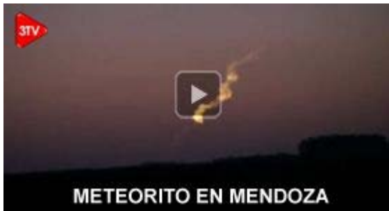
METEORITO EN MENDOZA