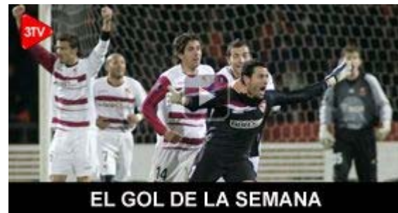
EL GOL DE LA SEMANA