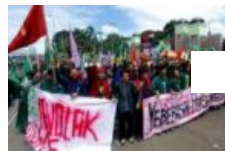
Paripurna RUU Ormas Dihadiri 356 Anggota DPR