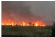
GAPKI Kerahkan Anggotanya Bantu Padamkan Kebakaran Hutan