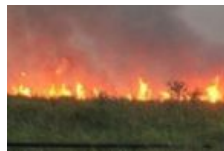
Presiden: Investigasi Kebakaran Hutan Riau Setelah Pemadaman