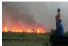
Polda Riau: 8 Orang Diduga Pembakar Lahan Ditangkap