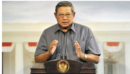
Presiden Susilo Bambang Yudhoyono

Lembaga riset berkantor pusat di Massachusetts Institute of Technology (MIT), Amerika Serikat (AS) tersebut diharapkan bisa berkontribusi dalam penanggulangan kemiskinan di Indonesia.