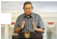
Presiden Ajak Institusi Global Tanggulasi Kemiskinan