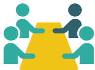
FIGURE 1. COMMENT FONCTIONNE LE PROJET?

Les enseignants participent à une formation de deux jours sur l'enseignement de la citoyenneté centré sur l'élève en début d'année scolaire.